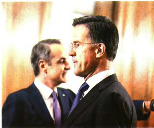
Ο Κυριάκος Μητσοτάκης με τον ΓΓ του ΝΑΤΟ Μαρκ Ρούτε σε παλαιότερη συνάντησή τους

Κι αυτό είναι η ΕΕ και η Τουρκία αναζητούν ένα διαφορετικό μοντέλο σχέσης, όπου οι γεωπολιτικές και αμυντικές προτεραιότητες διαχωρίζονται από την ενταξιακή διαδικασία και τα πολλαπλά ελλείμματα της Αγκυρας στους τομείς του κράτους δικαίου, του Διεθνούς Δικαίου, των αρχών καλής γειτονίας κ.λπ. Πράγματι, η γεωγραφία, ο ρόλος και το μέγεθος της Τουρκίας δεν είναι δυνατόν να αγνοηθούν. Είναι, όμως, η ελληνική στρατηγική σκέψη αυτή που πρέπει, εν μέσω ενός κόσμου που αλλάζει ταχύως, να αναζητήσει modus vivendi με τη γείτονα.