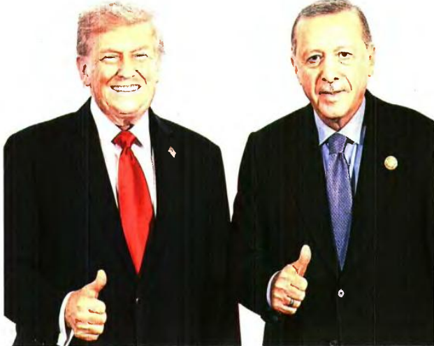
Ο Ντόναλντ Τραμπ με τον Ταγίπ Ερντογάν. Οι πρόσφατες δηλώσεις του πρώτου έφεραν χαμόγελα ακανοποίησης στην Αγκυρα

Ο «θίσος Σαμ» και τα δώρα Στην Αγκυρα δεν θα μπορούσαν να λάβουν καλύτερο δώρο από τις πρόσφατες δηλώσεις του Ντόναλντ Τραμπ περί κινήσεων «που θα κάνουν πολύ χαρούμενο τον τουρκο πρόεδρο». Το ταξίδι του «πλανητάρχη» στην Αγκυρα λειτουργεί σαφώς υπέρ της ανάδειξης του επιπέδου των δεσμών αλλά και των διαπροσωπι-