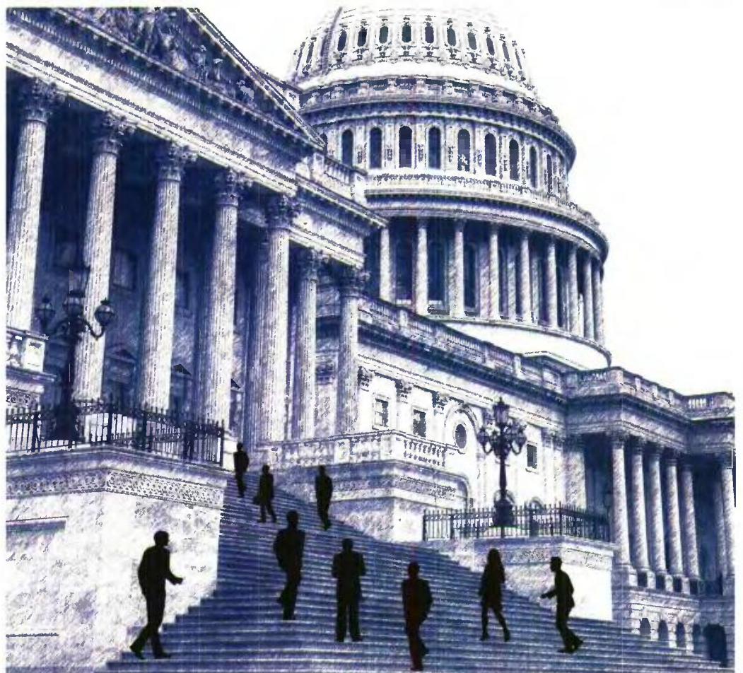
ILLUSTRATION TO BEMA

Πιέρρος Ι. Τζανετάκος, Μάνος Καραταράκης ΑΓΚΥΡΑ, ΑΝΤΑΠΟΚΡΙΣΗ Νίκος Μαροβίτης → ΣΕΛ. 22-25