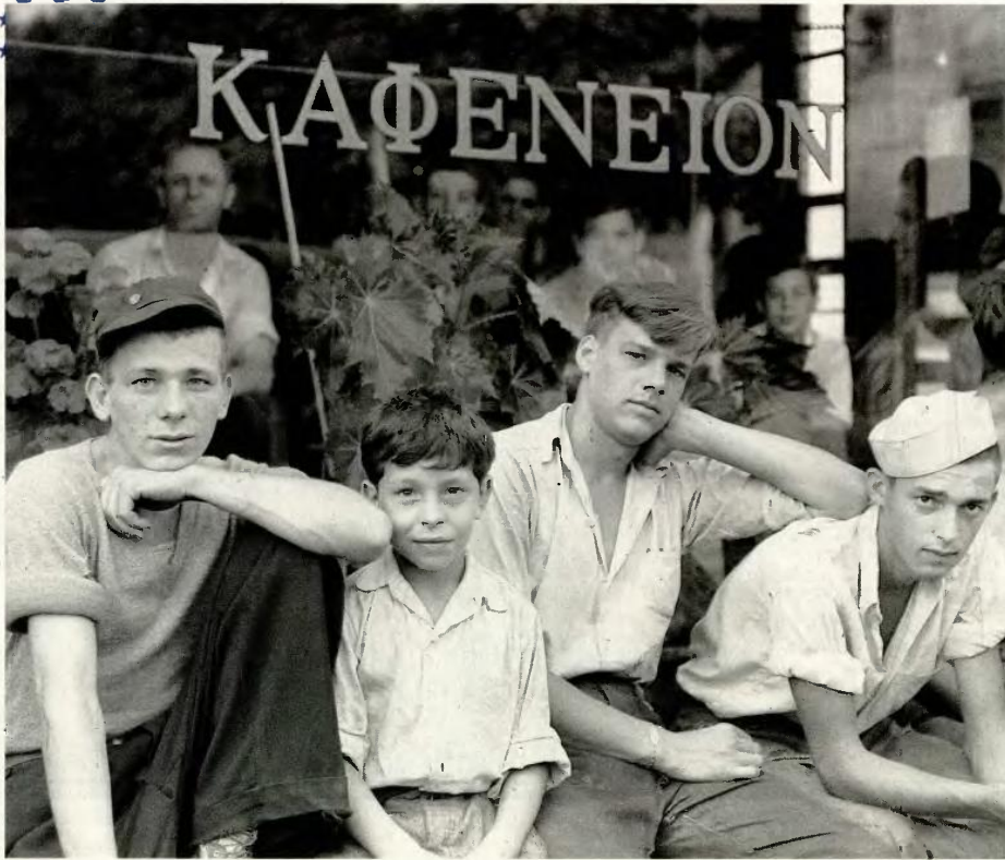
Ιούλιος του 1938 , Αμερική, Πενσιλβάνια. Τέσσερα αγόρια ποζάρουν στον φωτογραφικό φακό μπροστά στο ελληνικό «Καφενείον» της πόλης. Η ανάπτυξη της χαλυβουργίας στις αρχές του 20ού αιώνα κατέστρεψε την πόλη πόλο έλξης για τους μετανάστες κυρίως από την ανατολική και τη νότια Ευρώπη.