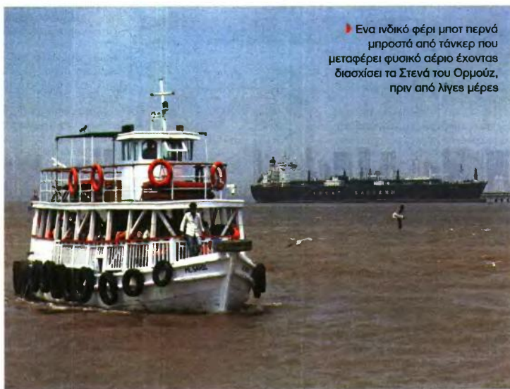
Ένα ιδιόκτο φέρι μποτ περνά μπροστά από τάνκερ που μεταφέρει φυσικό αέριο έχοντας διασχίσει τα Στενά του Ορμούζ, πριν από λίγες μέρες

Τελικά αύριο λήγει το τηλεσίγραφο που είχε θέσει αρχικά προς την Τεχεράνη για σήμερα ο πρόεδρος Τραμπ, ο οποίος χτες με συνέντευξή του στην εφημερίδα «Wall Street Journal» απείλησε να καταστρέψει όλους τους σταθμούς παραγωγής ενέργειας του Ιράν εάν οι ηγέτες της χώρας δεν συμφωνήσουν να ανοίξουν ξανά το Στενό του Ορμούζ, αυξάνοντας την πίεση στην Τεχεράνη. «Αν δεν περάσουν, αν θέλουν να το κρατήσουν κλειστό, θα χάσουν κάθε σταθμό παραγωγής ενέργειας και κάθε άλλο εργοστάσιο που έχουν σε ολόκληρη τη χώρα», δήλωσε. Όταν πείστηκε από τον δημοσιογράφο για το πόσο πιστεύει ότι θα τελειώσει ο πόλεμος απάντησε: «Θα σας ενημερώσω πολύ σύντομα». Και πρόσθεσε: «Βρισκόμαστε σε μια πολύ ισχυρή θέση και αυτή η χώρα θα χρειαστεί 20 χρόνια για να ανοικοδομηθεί, αν είναι τυχεροί, αν έχουν μια χώρα. Και αν δεν κάνουν κάτι μέχρι το βράδυ της Τρίτης, δεν θα έχουν σταθμούς παραγωγής ενέργειας και δεν θα έχουν γέφυρες όρθιες».