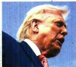
Ο πρόεδρος των ΗΠΑ Ντόναλντ Τραμπ μιλάει στα ΜΜΕ κατά την άφιξή του στο αεροδρόμιο του Μαϊάμι, στη Φλόριδα

Το σίγουρο, σε κάθε περίπτωση, είναι ότι η τροπή που έχει λάβει ο πόλεμος - ο οποίος διανύει ήδη την έκτη εβδομάδα του - δεν αφήνει πολλά περιθώρια αισιοδοξίας για τον τερματισμό του στο άμεσο μέλλον. Ειδικά δε η Τεχεράνη, εδώ που έχουν φτάσει τα πράγματα, έχει κάθε συμφέρον να συνεχίσει να παίζει... καθυστερώντας, κερδίζοντας πολύτιμο χρόνο τον οποίο