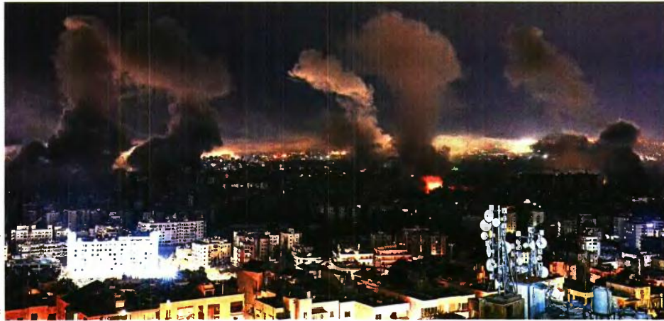
Καπνοί διακρίνονται σε διάφορα σημεία της Βηρυτού καθώς ο ισραηλινός στρατός βομβαρδίζει την πόλη στην προσπάθειά του να πλήξει τη λεζαμπολιά

Ο ιστορικός Αράς Αζίζι , που γεννήθηκε στην Τεχεράνη το 1988, ζει στις ΗΠΑ από 20 ετών. Λέκτορας στο Πανεπιστήμιο του Γέιλ, με τα διδακτορικούς υπότροφους και συγγραφέας βιβλίων για το Ιράν, το πιο πρόσφατο εκ των οποίων έχει τίτλο «What Iranians Want: Women, Life, Freedom» («Τι θέλουν οι Ιρανοί: Γυναίκα, Ζωή, Ελευθερία», Oneworld, 2024) είναι επίσης συνεργάτης του περιοδικού «The Atlantic». Ο Αζίζι μιλάει στο «Βήμα» με αφορμή τις εξελίξεις στο Ιράν.