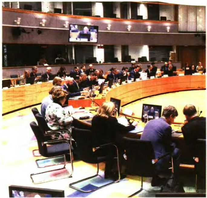
Ο πόλεμος στον Κόλπο αντρέπει τους ευρωπαϊκούς οικονομικούς σχεδιασμούς με αποτέλεσμα στο Eurogroup να σημάει «κόκκινος συναγερμός»

Επειδή τα τελευταία χρόνια η Ευρώπη βαδίζει από κρίση σε κρίση, όλοι έχουν γίνει πιο ψυχραμιοί. Παρ' όλα αυτά, ένα γεγονός τούς έχει σηματοποιήσει. Το Eurogroup δεν συνεδριάζει πάντα στο Justus Lipsius, αλλά και στο διπλό κτίριο Eurotop. Εκεί συνέδρασαν τον Ιανουάριο τον Πιερρακάκη για την προμερία του ως προέδρου η Λαγκάρντ και ο Πιερ Γκραμνιέν, ο γενικός διευθυντής του ESM και διάδοχος του Κλάους Ρέγκλινγκ. «This was the room», το είπαν, «αυτή είναι η αίθουσα». Ο Πι-