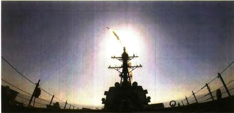
Αμερικανικό πολεμικό πλοίο εκτοξεύει κατευθυνόμενο πύραυλο κατά του Ιράν