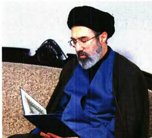
OFFICE OF THE BANIAN SUPREME LEADER WANA

ντας στον πόλεμο Ιράν - Ιράκ. Μετά τον πόλεμο, φοίτησε στη θεολογική σχολή της Κομ, για να επιστρέψει στην Τεχεράνη και να εργαστεί στο Γραφείο της Ανώτατης Ηγεσίας, υπό την εποπτεία του πατέρα του – μια δομή της οποίας αργότερα θα ηγηθεί ο ίδιος. Το 2005 υποστήριξε τον Μαχμούντ Αχμανινεζάντ, τότε τον πιο συντηρητικό υποψήφιο, και συμμετείχε στην καταστολή του Πράσινου Κινήματος, που κατήγγειλε εκλογική νοθεία. Ανάλογο ρόλο είχε και σε άλλες διαδηλώσεις, κατεβύθοντας την καταστολή. Η άποψη πολλών ιρανών παρατηρητών είναι πως δεν θα ήταν ένας πραγματιστής ηγέτης με διάθεση να οδηγήσει τη χώρα σε νέο δρόμο, αλλά πιστός συνεχιστής της σκληρής γραμμής του πατέρα του και πιθανόν ακόμη πιο ακραίος.