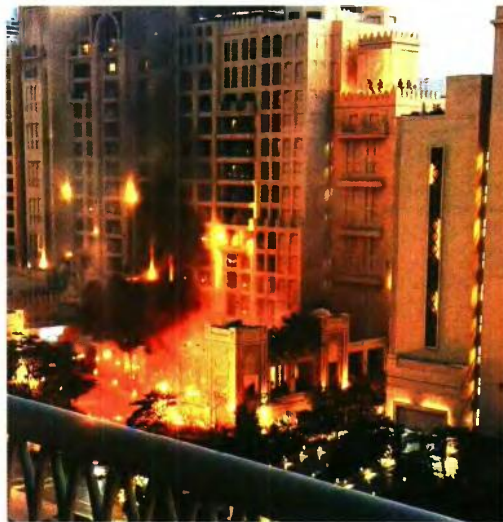
► Πυρκαγιά που προκλήθηκε από την ιρανική επίθεση στο πολυτελές ξενοδοχείο «Fairmont The Palm» στο Ντουμπάι στα ΗΑΕ

Λόγω του εκτεταμένου κλεισίματος του εναερίου χώρου στις χώρες του Περσικού Κόλπου, το Σάββατο, μεγάλο μέρος των υπερπτάμενων αεροσκαφών της πολιτικής αεροπορίας χρησιμοποιήσε το ελληνικό FIR, ενώ από χθες, Κυριακή, η κίνηση μειώθηκε κατακόρυφα.