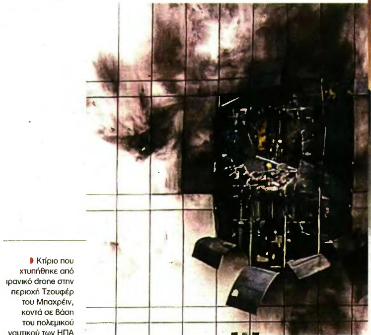
► Κρίριο που κτυπήθηκε από ιρανικό drone στην περιοχή Τζουφέρ του Μπαχρέν, κοντά σε βάση του πολεμικού ναυτικού των ΗΠΑ

Ο πρόεδρος του κοινοβουλίου έχει υπηρέτήσει στις τάξεις των Φρουρών της Επανάστασης και είχε διατελέσει πρώην αρχηγός της αστυνομίας. Εκτός του ότι ήταν ένας από τους πιο πιστούς οπαδούς του Χαμενεΐ, συνεργάστηκε εκτενώς με τον Κασέμ Σολεϊμάνι, τον στρατηγό που ηγήθηκε της Μερκχίας Κουντς, του σώματος των Φρουρών που συντονίζει τις σιτικές πολιτοφυλακές στη Μέση Ανατολή και είχε δολοφονηθεί από αμερικανικό drone με εντολή Τραμπ τον Ιανουάριο του 2020.