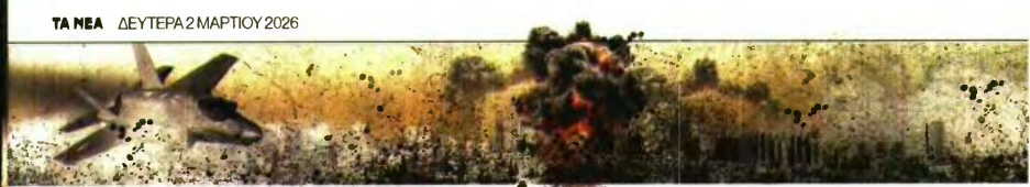
ΤΑ ΝΕΑ ΔΕΥΤΕΡΑ 2 ΜΑΡΤΙΟΥ 2026