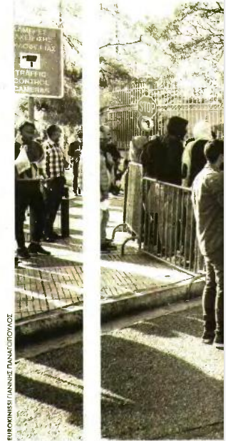
ΕΠΙΧΕΙΡΗΣΙΑΣ ΚΑΤΑ ΤΗΝ ΕΙΣΟΔΟΥΣ ΤΗΣ ΧΩΡΑΣ

Πάντως, η νέα σαφώς πιο σκληρή προσέγγιση έχει φέρει και πιο μεγάλους αριθμούς στο κορμάτι των ανακλήσεων. Είναι ενδεικτικό πως την επταετία 2013-2020 πραγματοποιήθηκαν συνολικά 19 ανακλήσεις καθεστώτων διεθνούς προστασίας, την ώρα που την περίοδο 2021-2025 οι ανακλήσεις ανήλθαν σε 583. Μόνο κατά την περσινή χρονιά καταγράφηκαν 196 ανακλήσεις ενώ για το 2026 έχουν ήδη δρομολογηθεί επιπλέον 47 περιπτώσεις.