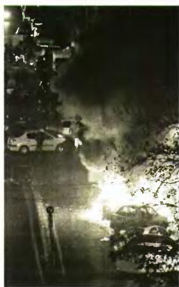
► Ένα αυτοκίνητο καίγεται στην Τεχεράνη κατά τη διάρκεια των διαδηλώσεων