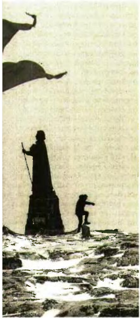
Η σημαία της Δανίας κυματίζει δίπλα στο άγαλμα του λουθηρανού «Απόστολου της Γροιλανδίας» Χανς Εγκεντε, στην πρωτεύουσα του νησιού, Νουούκ