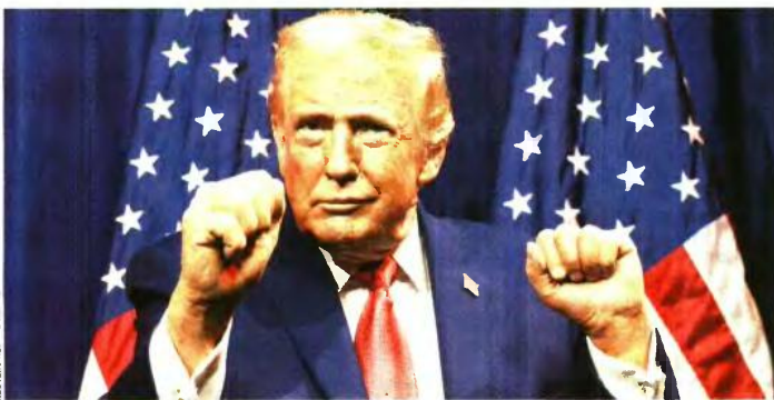
Ο πρόεδρος των ΗΠΑ Ντόναλντ Τραμπ κάνει χειρονομίες καθώς μιλάει στους Ρεπουμπλικανούς της Βουλής των Αντιπροσώπων στο Κέντρο Κένεντι, το οποίο μετονομάστηκε σε... Κέντρο Τραμπ - Κένεντι, στην Ουάσινγκτον