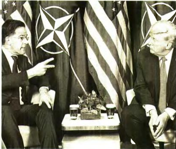
► Ο πρόεδρος των ΗΠΑ Ντόναλντ Τραμπ στη συνάντησή του με τον γενικό γραμματέα του ΝΑΤΟ Μαρκ Ρούτε στο Παγκόσμιο Οικονομικό Φόρουμ, στο Νταβός της Ελβετίας