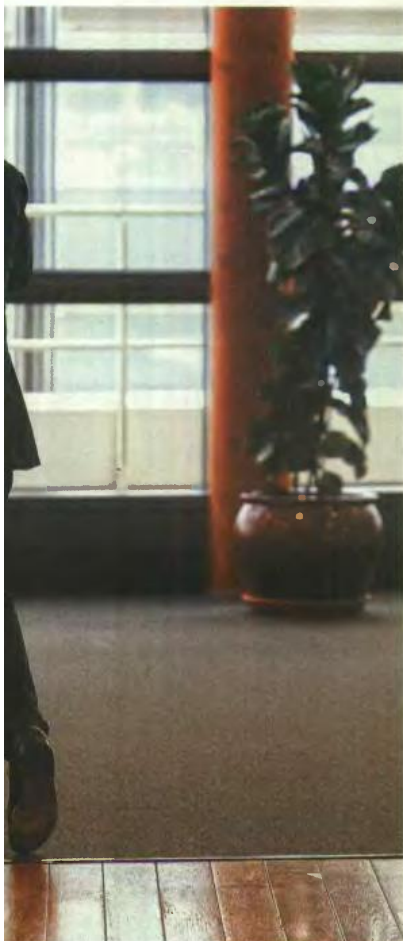
Η πρόεδρος της Ευρωπαϊκής Επιτροπής Ούρσουλα φον ντερ Λάιεν (αριστερά) υποδέχεται τον γενικό γραμματέα του ΝΑΤΟ Μαρκ Ρούτε στην έδρα της Ευρωπαϊκής Επιτροπής στις Βρυξέλλες

Βέβαια, η ΕΕ πρέπει να αντιληφθεί ότι οι Ηνωμένες Πολιτείες παραμένουν ο κύριος στρατηγικός σύμμαχός της, με μία αξιοσημείωτη ικανότητα προβολής αποτρεπτικής ισχύος πάνω από τη Γηραιά Ηπειρο. Το κρίσιμο ερώτημα δεν είναι εάν οι ΗΠΑ απομακρύνονται, αλλά εάν και υπό ποιους όρους δύναται η Ευρώπη να τις πείσει να παραμείνουν στενοί εταίροι εν καιρώ πολυπολικότητας στο διεθνές σύστημα. Η διέξοδος δεν εδράζεται ούτε στην άνευ όρων συμμόρφωση με τις αμερικανικές απαιτήσεις ούτε στη ρήξη με τις ΗΠΑ και τη χάρση ενός αυτονόμου δρόμου γεμάτου κινδύνους και απεχαιδιότητες, αλλά στη σταδιακή διαμόρφωση μιας ενωμένης Ευρώπης πολιτικά ώριμης, που θα εμπνέει θεσμική εμπιστοσύνη και θα καθίσταται, εκ των πραγμάτων, αξιόπιστος και αναγκαίος στρατηγικός εταίρος. ●