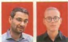
Γράφουν οι Σπύρος Μπλαβούκος και Πάνος Πολίτης Λάμπρου

Από τη διατλαντική συνεργασία του 2022 στη σκληρή κριτική του 2025, η αμερικανική στρατηγική αλλάζει τόνο και ουσία. Η Ευρώπη καλείται να απαντήσει όχι μόνο σε μια γεωπολιτική μετατόπιση, αλλά σε μια ευθεία πολιτική αμφισβήτηση