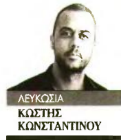
ΛΕΥΚΩΣΙΑ ΚΩΣΤΗΣ ΚΩΝΣΤΑΝΤΙΝΟΥ

Ενα σκηνικό το οποίο δεν έχει καταγραφεί προηγουμένως, με εξελίξεις σε όλα τα επίπεδα κυρίως δε εκείνα της άμυνας και της ενέργειας, διαμορφώνεται στη νοτιοανατολική Μεσόγειο. Τα όσα η Κύπρος υπομονετικά επένδυσε τα τελευταία χρόνια αποδίδουν καρπούς και μάλιστα η κερδοφορία είναι πλούσια και συνεχής. Αυτό φάνηκε για άλλη μια φορά όταν - μέσα σε 24 ώρες - ο πρόεδρος των Ηνωμένων Αραβικών Εμιράτων σείχη Μοχάμεντ μπιν Ζαγιέντ Αλ Ναχγιάν έφτανε επικεφαλής πολυμερούς αντιπροσωπείας οικονομικών και άλλων παραγόντων της χώρας στην Κύπρο, σε μια ιστορική επίσκεψη, και μερικές ώρες μετά ο κύπριος πρόεδρος Νίκος Χριστοδουλίδης ταξίδευε στο Παρίσι προκειμένου να «κλειδώσει» και εκεί τη συμφωνία Στρατηγικής Εταιρικής Σχέσης. Η τελευταία είναι εξόχως σημαντική για τις δύο χώρες αφού από το 1,2 δισ. ευρώ που θα πάρει η Κύπρος από το SAFE το 85% θα καταλήξει στην αγορά οπλικών