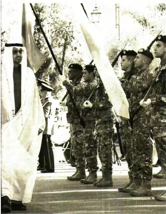
Ο πρόεδρος της Κυπριακής Δημοκρατίας Νίκος Χριστοδουλίδης υποδέχεται στο Προεδρικό Μέγαρο τον πρόεδρο των Ηνωμένων Αραβικών Εμιράτων σείχη Μοχάμεντ μπν Ζαγιέντ Αλ Ναχγιάν