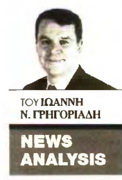
ΤΟΥ ΙΩΑΝΝΗ Ν. ΓΡΗΓΟΡΙΑΔΗ NEWS ANALYSIS

Η υπόθεση του αγωγού GSI και η διάσταση απόψεων που παρατηρήθηκε μεταξύ των κυβερνήσεων της Ελλάδας και της Κύπρου ανέδειξε εκ νέου το ερώτημα αν είναι αυτονόητη η ταύτιση των στρατηγικών συμφερόντων των δύο κρατών. Εγινε σαφές ότι η Τουρκία δεν αποτελεί το αποκλειστικό εμπόδιο στην πόντιση του αγωγού GSI. Εγχώρια ελληνοκυπριακά οικονομικά συμφέροντα, τα οποία προτιμούν να μη διασυνδεθεί η Κύπρος στο ευρωπαϊκό ηλεκτρικό δίκτυο, ώστε να διατηρήσουν την ολιγοπωλιακή τους θέση στην κυπριακή αγορά ηλεκτρισμού, είναι αρκετά ισχυρά, ώστε να επηρεάζουν τη θέση της κυπριακής κυβέρνησης στο ζήτημα. Η θέση αυτή υπονομεύει τα ελλαδικά και ευρωπαϊκά συμφέροντα, τα οποία προσβλέπουν στη λειτουργία της Κύπρου ως γέφυρας μεταξύ της Ευρωπαϊκής Ενώσεως και της Μέσης