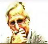
ΤΟΥ Π.Κ. ΙΩΑΚΕΙΜΙΔΗ