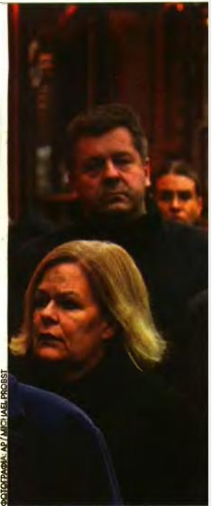
↑ Ο καγκελάριος Ολαφ Σολτς στη χριστουγεννιάτικη αγορά του Μαγδεμβούργου όπου πέντε πολίτες βρήκαν τον θάνατο και περισσότεροι από 200 τραυματίστηκαν. Η τρομοκρατική επίθεση έκανε το (προεκλογικό) κλίμα στη Γερμανία ακόμη πιο βαρύ

κτυα, ότι ο Αμπντουλόχσεν ήταν ισλαμιστής. Ένα στοιχείο που το υποδεικνύει είναι η διαθήκη του, που βρέθηκε στο αυτοκίνητο με το οποίο διαπράχθηκε το έγκλημα. Σε αυτή ο 50χρονος όριζε ότι, σε περίπτωση θανάτου του (κάτι που προφανώς θεωρούσε πιθανό), όλη του η περιουσία θα μεταβιβάζονταν στον Γερμανικό Ερυθρό Σταυρό - πράξη που δύσκολα παραπέμπει σε ισλαμιστή δολοφόνο. Στα γερμανικά μέσα ενημέρωσης γίνεται λόγος για συμπάθειες του δράστη προς την AfD. Σε αναρτήσεις του στο X φέρεται να έκανε αναφορές σε κοινά σχέδια με την AfD. Μεταξύ αυτών, περιλαμβανόταν η δημιουργία μιας ακαδημίας για μουσουλμάνους που έχουν εγκαταλείψει την πίστη τους. Σχετικά με αυτό έγραψε: «Ποιος άλλος πολεμάει το Ισλάμ στη Γερμανία (εκτός από την AfD);». Στις πολυάριθμες δηλώσεις της AfD για το θέμα δεν γίνεται