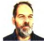
ΤΟΥ ΓΙΩΡΓΟΥ ΠΑΛΥΓΟΥΠΟΥΛΟΥ

Από τη μία βρίσκεται η βαθιά Τουρκία όπου κυριαρχεί ο τόνος του Ισλάμ. Από την άλλη, η δυτική και παράκτια Τουρκία, που ενδιαφέρεται για τα δημοκρατικά δικαιώματα