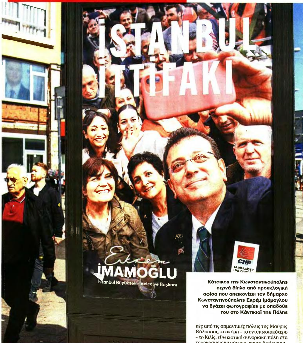
Κάτοικος της Κωνσταντινούπολης περνά δίπλα από προεκλογική αφίσα που απεικονίζει τον δήμαρχο Κωνσταντινούπολης Εκρέμ Ιμράμογλου να βγάζει φωτογραφίες με οπαδούς του στο Κάντικιό της Πόλης

«Οι εκλογές του Μαρτίου του 2024 θα μπορούσαν να θεωρηθούν μια από τις πιο ενδιαφέρουσες εκλογικές ανιμετρήσεις στη σύγχρονη τουρκική ιστορία. Το CHP όχι μόνο κέρδισε τις πέντε μεγαλύτερες πόλεις (Κωνσταντινούπολη, Αγκυρα, Σμύρνη, Αδανα, Προύσα), αλλά και 35 από τα 81 επαρχιακά κέντρα της Τουρκίας. Αυτή τη φορά οι σοσιαλδημοκράτες δεν κέρδισαν μόνο τα αστικά κέντρα της δυτικής Τουρκίας, αλλά και μερι-