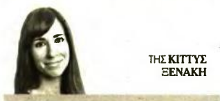
THE KITTYΣ ΞΕΝΑΚΗ

ΜΕ ΤΟ ΒΛΕΜΜΑ ΣΤΗ ΒΟΥΛΓΑΡΙΑ. «Δεν ξέρω γιατί θα πρέπει να αλλάξουμε εμείς συμπεριφορά, εάν λάβουμε την εμπιστοσύνη των πολιτών» δήλωσε ο Μίτσοσκι ερωτηθείς πώς θα κατονομάζει τη χώρα, στο εσωτερικό και στο εξωτερικό, σε περίπτωση που εκλεγεί πρωθυπουργός. «Για εμένα η Μακεδονία είναι και θα είναι Μακεδονία. Πάνω σε αυτό δεν υπάρχουν αμφιβολίες». Ορισμένοι αναλιτές, βέβαια, εκτιμούν πως ο Μίτσοσκι είχε πρωτίστως στο μυαλό του τις διαπραγματεύσεις που βρίσκονται σε εξέλιξη με τη Σόφια – η οποία έχει ξεκαθαρίσει, με τη σύμφωνη γνώμη των Βρυξελλών, ότι δεν θα άρει το βέτο της στην ένταξη των Σκοπίων στην ΕΕ παρά μόνον αφού η Βόρεια Μακεδονία κατοχυρώσει συνταγματικά την παρουσία «βουλγαρικού λαού» μεταξύ των υπόλοιπων εθντικών ομάδων της. Και όλοι οι αναλιτές συμφωνούν πως όποιος και αν σχηματίσει την επόμενη κυβέρνηση θα αντιμετωπίσει πίεση τόσο από την ΕΕ όσο και από τις ΗΠΑ να τηρήσει τις συμφωνίες που έχει υπογράψει η χώρα και να προωθήσει τις (αντιδημοφιλείς) συνταγματικές αλλαγές που απαιτούνται. Μια από αυτές είναι και η προσαρμογή των ταξιδιωτικών της εγγράφων στη νέα συνταγματική της ονομασία, ένας από τους λόγους που επικαλείται η ελληνική κυβέρνηση για την άρνησή της