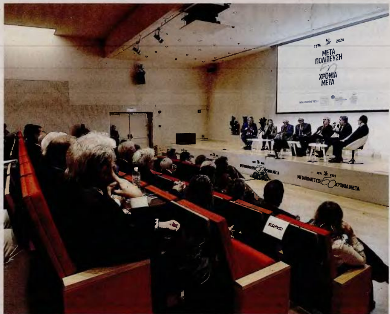
Ένα από τα πάνελ του συνεδρίου που διοργάνωσε η «Κ», σε συνεργασία με το Μορφωτικό Ίδρυμα Εθνικής Τραπέζης, το Οικονομικό Φόρουμ των Δελφών και το Ελληνικό Παρατηρητήριο του London School of Economics. Όσα κατέθεσαν οι ομιλητές στο τραπέζι του διαλόγου είναι ένας χρήσιμος μπουσουλάς για τη συνέχεια της διαδρομής που άρχισε πριν από μισόν αιώνα.

Το συνέδριο ήταν μια αναγκαία, ενδιαφέρουσα και προτρεπτική άσκηση αυτογνωσίας, συλλογικής αλλά και ατομικής για αρκετούς από τους συμμετέχοντες. Η Μεταπολίτευση έγινε αντιληπτή ως η ιστορική στιγμή της αποκατάστασης της Δημοκρατίας το 1974 αλλά και ως μια ολόκληρη περίοδος πενήντα ετών που παρά τις τομές, εσωτερικές και διεθνείς, διατηρεί την ικανότητά της να παρατείνεται. Εχω την αίσθηση ότι το συνέδριο ανέδειξε τη διαπίστωση ότι η Μεταπολίτευση, ως περίοδος, δεν τελείωσε παρά τη διαρκή μετεξέλιξη της και παρά τη συνολική αμφισβήτηση και εντέλει την επαναμελίωσή της την περίοδο της οικονομικής κρίσης. Αντικείμενο του συνεδρίου ήταν η πολιτική όψη της Μεταπολίτευσης, οι αφηγήσεις των πολιτικών πρωταγωνιστών της και η αξιολόγηση των βασικών πολιτικών που εφαρμόστηκαν, ιδίως μετά το 1990. Πίσω όμως από την πολιτική αφήγηση φαινόταν όλες οι άλλες όψεις της Μεταπολίτευσης. Η πεντηκονταετία το-