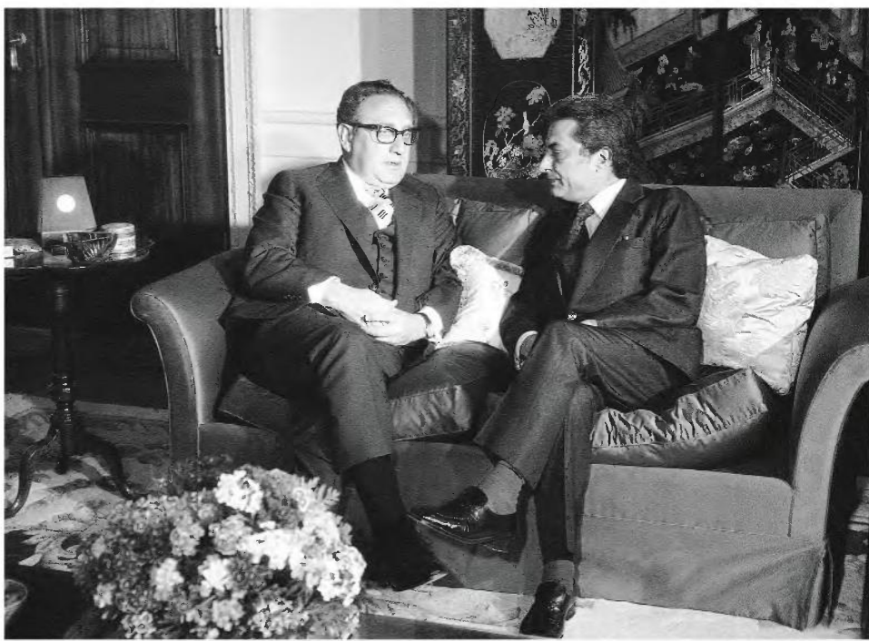
Συνουμία του Δημήτρη Μπίτσιου, υπουργού Εξωτερικών της Ελλάδας, με τον Χένρι Κίσιγκκερ στις Βρυξέλλες τον Μάιο του 1975, πριν από τη σύνοδο του ΝΑΤΟ.

Η ελληνική κυβέρνηση αντέδρασε με διακοπή των διαπραγματεύσεων με τις ΗΠΑ. «Ήταν εντελώς ανοικτή η τακτική της αμερικανικής διπλωματίας να διαπραγματευτεί παράλληλα με την Ελλάδα και την Τουρκία νέες αμυντικές Συμφωνίες και να τις χειρίζεται με άλλα μέτρα νέα αμυντική συμφωνία, που συνοδευόταν από υποχρέωση των ΗΠΑ να καταβάλουν στην Τουρκία ένα δισεκατομμύριο δολάρια σε βάθος τετραετίας. Ο Δημήτρης Μπίτσιος περιγράφει αυτή την αμερικανοτουρκική