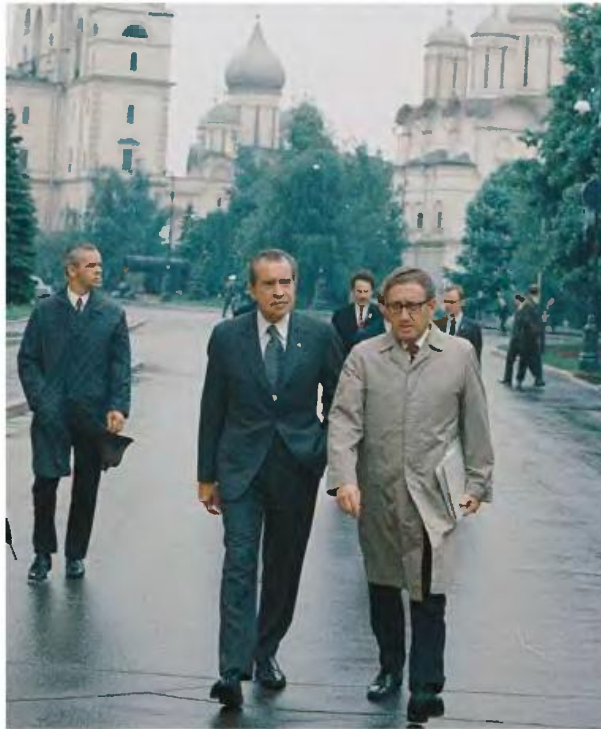
Με τον πρόεδρο Νίξον στο Κρεμλίνο τον Μάιο του 1972. Ο Κίσινγκερ ήταν σε μεγάλο βαθμό υπεύθυνος για την προσέγγιση της Ουάσινγκτον με τη Μόσχα.

Ο Κίσινγκερ υπήρξε ο πιο γνωστός ίσως θιασώτης της Realpolitik στην εποχή μας, σε βαθμό να κατηγορηθεί επανειλημμένως για κυνισμό και αμοραλισμό. Για τον λόγο αυτό, άλλωστε, η απονομή του Νομπέλ Ειρήνης στον Κίσινγκερ το 1973 για τη συνδρομή του στον τερματισμό του πολέμου του Βιετνάμ έτυχε εντονότατης (και όχι αδικαιολόγητης) κριτικής. Σε κάθε περίπτωση, ο Κίσινγκερ πρότασε την ισχύ έναντι της ιδεολογίας – εξάλλου ο ίδιος πρόβαλε την ανάγκη αποϊδεολογικοποίησης του Ψυχρού Πολέμου.