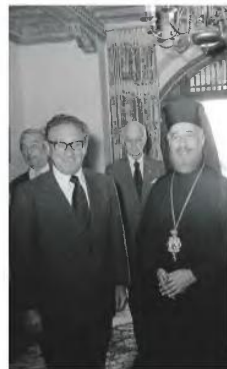
Χένρι Κισινγκερ και Αρχιεπίσκοπος Μακάριος στη Λευκωσία τον Μάιο του 1974.

μονή υπέρ της επιστροφής του». Ο Μπόγιατ στην επιστολή δεν εξηγούσε μόνο τα λάθη που έκανε η αμερικανική διπλωματία, αλλά προέτρεπε τον Κισινγκερ να προβεί άμεσα σε κινήσεις για να αποτραπεί ο «Αττίλας 2», τις