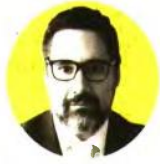
ΑΡΘΡΟ ΤΟΥ Δρ. ΘΕΟΔΩΡΟΥ ΤΣΑΚΙΡΗ, ΑΝΑΠΛΗΡΩΤΗ ΚΑΘΗΓΗΤΗ ΓΕΩΠΟΛΙΤΙΚΗΣ & ΕΝΕΡΓΕΙΑΚΗΣ ΠΟΛΙΤΙΚΗΣ ΤΟΥ ΠΑΝΕΠΙΣΤΗΜΙΟΥ ΛΕΥΚΩΣΙΑΣ