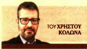
ΤΟΥ ΧΡΗΣΤΟΥ ΚΟΛΩΝΑ

Μικρές διακυμάνσεις στις τιμές φυσικού αερίου και ηλεκτρικού ρεύματος προβλέπουν οι ειδικοί ■ Τι δηλώνουν στα «ΝΕΑ» Γιώργος Στάμτσος και Μιχάλης Μαθιουλάκης