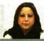
ΤΗΣ ΑΛΕΞΑΝΔΡΑΣ ΦΩΤΑΚΗ

Η Συνθήκη της Λωζάννης αποτελεί το κείμενο που όρισε τα σύνορα της Τουρκικής Δημοκρατίας με τους γείτονές της βάζοντας τέλος στην Οθωμανική Αυτοκρατορία. Στόχος να πετύχει τη σταθερότητα και την οριστικότητα, έχοντας πετύχει μέχρι σήμερα να εγγυ-