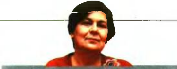
ΤΗΣ ΜΑΡΙΑΣ ΓΑΒΟΥΝΕΑΗ