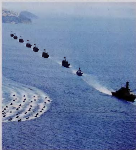
Η «Γαλάζια Πατρίδα» «κατοχυρώθηκε» ως θεωρητικό πλαίσιο με στρατηγικές διαστάσεις στο επιχειρησιακό πλαίσιο μιας μεγάλης ναυτικής άσκησης το 2019. Η άσκηση Mavi Vatan 2019 έλαβε χώρα στη Μαύρη Θάλασσα, στο Αιγαίο και στην Ανατολική Μεσόγειο σε μια εντυπωσιακή επίδειξη επιχειρησιακών ικανοτήτων του τουρκικού πολεμικού ναυτικού.

ρώς υφαλοκρηπίδας μεταξύ των δύο αντικείμενων ηπειρωτικών ακτών. Τα νησιά για την Τουρκία ή δεν δικαιούνται υφαλοκρηπίδα ή επειδή κείνται στη «λάθος πλευρά», ενθουλακώνονται. Υπάρχει μια τρίτη παράμετρος, ότι εμποδίζουν λόγω της θέσης τους τις ακτές από προβολή διεκδική-