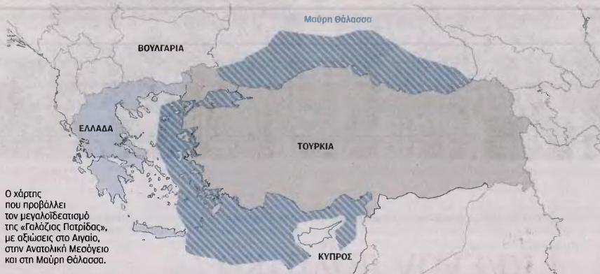
Ο χάρτης που προβάλλει τον μεγαλοιδεασμό της «Γαλάζιας Πατρίδας», με αξιώσεις στο Αιγαίο, στην Ανατολική Μεσόγειο και στη Μάυρη Θάλασσα.

Βασικό στοιχείο της γεωπολιτικής κατεύθυνσης της σημερινής Τουρκίας είναι ο θαλάσσιος χώρος. Εντούτοις, η θάλασσα δεν ήταν ποτέ μεταξύ των κρίσιμων στρατηγικών προτεραιοτήτων της ύστερης Οθωμανικής Αυτοκρατορίας ούτε της κεμαλικής Τουρκίας των πρώτων χρόνων, γι' αυτό και παρά την οριστική απώλεια των νησιών του Αιγαίου, η Λωζάννη είχε θεωρηθεί και αντιμετωπιστεί αρχικά ως επιτυχία και είχε προβληθεί στο εσωτερικό ως τέτοια. Αυτό οφειλόταν σε σημαντικό βαθμό και στην ιστορική ταυτότητα του τουρκικού έθνους ως κατά βάση χερσαίου. Ακόμη και ο νομαδικός χαρακτήρας των Οθωμανών εξελίχθηκε σε εγκατεστημένο αγροτο-κτηνοτροφικό και η επιδίωξη της θαλάσσιας κυριαρχίας με τη χρησιμοποίηση κατά κύριο λόγο μουσουλμάνων πειρατών υπήρξε εφήμερη και διακόπηκε με τη Ναυμαχία της Ναυπάκτου [1571]. Από τις αρχές της δεκαετίας του 1970, όμως, αυτό άρχισε να αλλάζει. Η ανάπτυξη των τεχνικών δυνατοτήτων αντίληψης πετρελαίου στον θαλάσσιο χώρο, η ανακάλυψη και εκμετάλλευση του κοιτάσματος του Πρίνου στο Αιγαίο και οι διεργασίες για τη νέα Σύμβαση των Ηνωμένων Εθνών για το Δίκαιο της Θάλασσας σήμαναν συναγερμό στις τουρκικές πολιτικο-στρατιωτικές ελίτ. Ξαφνικά, η Τουρκία άρχισε να «ασφυκτιά»