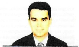
TOY ΙΩΑΝΝΗ Ν. ΓΡΗΓΟΡΙΑΔΗ

Ε νώ απομένει λιγότερο από ένας μήνας μέχρι τις τουρκικές προεδρικές και βουλευτικές εκλογές, διεξάγεται ένας σύνθετος προεκλογικός αγώνας. Από τη μια οι υποψήφιοι για τις προεδρικές εκλογές εντείνουν την εκστρατεία τους. Ενώ ο υποψήφιος του συνασπισμού της αντιπολίτευσης Κεμάλ Κιλιτσντάρογλου φέρεται να προηγείται με βραχεία κεφαλή του προέδρου Ρετζέπ Ταγίπ Ερντογάν, προκαλεί το ενδιαφέρον και η επίδοξη των άλλων δύο υποψηφίων, Μουκαρέμ Ιντζέ και Σινάν Ογκάν. Ιδίως η υποψηφιότητα Ιντζέ φαίνεται να προσελκύει υπολογισμό υποστήριξη από ψηφοφόρους που ανήκουν ιδεολογικά στον συνασπισμό της αντιπολίτευσης και