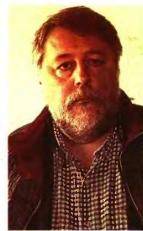
Γεννήθηκε στο Λβιβ της Ουκρανίας πριν από 59 χρόνια.

Ο ρωσοουκρανός σκηνοθέτης θεωρεί ότι ο «τάρος» τελικά θα κάνει χρήση απαγορευμένων όπλων για να αποφύγει παραπομπή του στο δικαστήριο της Χάγης