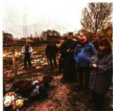
Στημιόστιο από την επίσκεψη της Προέδρου της Δημοκρατίας Κατερίνας Σακελλαροπούλου στο Κίεβο, τον Νοέμβριο του 2022

Γεγονός είναι ότι ο πόλεμος στον χειμώνα δεν τελειώνει. Οι Ουκρανοί περιμένουν νέα δυνάμει όπλα, ατμήμα που διατυπώθηκε και προς την Αθήνα. Ζήτησαν S-300 (αντιαεροπορικούς), TOR Mi-1, τεθωρακισμένα μεταφορικά προσωπικού BMP-1, ακόμα και Λέοπαρντ. Και όμως η Ελλάδα ήταν από τις πρώτες χώρες που πρόσφερε στρατιωτική βοήθεια. Δεν στείλαμε οπλισμό που θα μπορούσε να προκαλέσει τρέψα στην αμυντική θωράκιση της χώρας αλλά τυφώματα τύπου καλασνικοφ, τα οποία προέρχονταν από κατασχέσεις. Αναρμωτικά και συγκεκριμένα όπλα τύπου RPG-18. Πυρομαχικά, όπως ρουκέτες 122 χιλιοστών G-2000, και βεβαίως τα BMP-1, τα οποία όμως