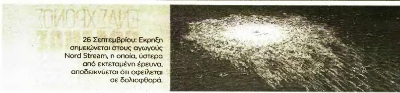
26 Σεπτεμβρίου: Εκρήξη αημιώνεται στους αγωγούς Nord Stream, η οποία, ύστερα από εκτεταμένη έρευνα, αποδεικνύεται ότι οφείλεται σε δολιοφθορά.