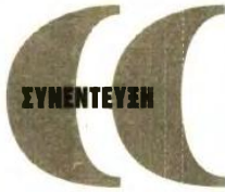
ΣΤΟΝ ΜΑΡΚΟ ΚΑΡΑΖΑΡΙΝΗ