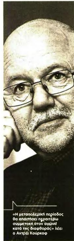
«Η μεταπολεμική περίοδος θα απαιτήσει περαιτέρω συμμετοχή στον αγώνα κατά της διαφθοράς» λέει ο Αντρέι Κούρκοφ

Α πό τις Ηνωμένες Πολιτείες, όπου βρίσκεται αυτές τις μέρες, ο Αντρέι Κούρκοφ δηλώνει σε μια σύντομη συνέντευξη με «Το Βήμα» ότι το κυρίαρχο συναίσθημα που νιώθει έναν χρόνο μετά τη ρωσική εισβολή είναι η αποφασιστικότητα. «Αποφασιστικότητα για τη χώρα μου αλλά και για τον εαυτό μου, να κάνουμε ό,τι είναι απαραίτητο προκειμένου να ξεπεράσουμε αυτή τη φρικτή περίοδο. Δεν είμαι στρατιωτικός, ξέρω όμως ότι η Ρωσία έχει στη διάθεσή της πληθώρα πόρων, ανθρώπων και υλικών, και ότι το καθεστώς του Κρεμλίνου δεν θα φοισθεί αυτόν όσο οι ηγέτες του πιστεύουν ότι μπορούν να επαφεληθούν από την επιθετικότητά τους. Βέβαια, στην πραγματικότητα η Ρωσία έχει ήδη χάσει πάρα πολλά, σχεδόν τα πάντα, συμπεριλαμβανομένης της ψήμης της, αν την είχε ποτέ, ως μεγάλου έθνους. Το Κρεμλίνο κλείνει τα μάτια μπροστά σε όλα αυτά. Στέλνει ανθρώπους από μακρινές επαρχίες και υποτελή κράτη να πεθάνουν στην Ουκρανία υποτιμώντας πλήρως τη ζωή τους. Μια εξέγερση στη Ρωσία θα βοηθούσε, αλλά κάτι τέτοιο δεν φαίνεται στον ορίζοντα».