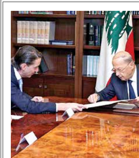
Ο Αμερικανός διαπραγματευτής για ενεργειακά ζητήματα Άμος Χόχσταϊν (στο κέντρο) με τον Λιβάνο Πρόεδρο συζητήσαν το όλο θέμα σε ανώνυμότη τους στη Βηρυτό, μέσα Ιουνίου.

*Ο δρ Γαβριήλ Χαρίτος διδάσκει Ιστορία των Πολιτικών Σχέσεων Κύπρου-Ελλάδας-Ισραήλ στο Πανεπιστήμιο Κύπρου, στο Πάντειο Πανεπιστήμιο και στο ισραηλινό Πανεπιστήμιο Μπεν-Γκουριόν. Είναι ερευνητής του ΕΛΙΑΜΕΠ (Πρόγραμμα Μεσογείου).