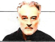
ΤΟΥ ΛΟΥΚΑ ΤΣΟΥΚΑΛΗ

ΣΕ ΚΑΘΕ ΠΕΡΙΠΤΩΣΗ , ο Σολτς δεν είναι ακριβώς εκείνο το είδος του ανθρώπου που έχει την ικανότητα να εμπνέει και να ξεσηκώνει τα πλήθη. Ορισμένοι τον έχουν χαρακτηρίσει «πολιτικό - ρομπότ», τόσο για την οργανωτικότητα που επιδεικνύει, όσο και για τον τρόπο με τον οποίο στέκεται και συμπεριφέρεται στις δημόσιες εμφανίσεις του. Όσοι, μάλιστα, είχαν την υπομονή να παρακολουθήσουν τις τρεις τηλεμαχίες με τους δύο άλλους βασικούς διεκδικητές της καγκελαρίας, τον Αρμίν Λάσετ και την Αναλένα Μπέρμπεκ,