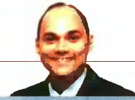
ΤΟΥ ΔΗΜΗΤΡΗ ΤΣΑΡΟΥΚΑ