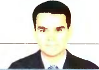
ΤΟΥ ΙΩΑΝΝΗ Ν. ΓΡΗΓΟΡΙΑΔΗ

Συνεπώς σήμερα, ο Ταγίπ Ερντογάν καλείται να διαχειριστεί ένα πολιτικό παράδοξο, που είναι ταυτόχρονα και μια κοινωνιολογική λογική: Την ωρίμανση και τον εκσυγχρονισμό δυο ομάδων οι οποίες ωριμάζουν και εκσυγχρονίζονται χάρη στον ίδιο.