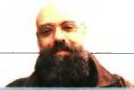
ΤΟΥ ΕΥΑΓΓΕΛΟΥ ΑΡΕΤΑΙΟΥ