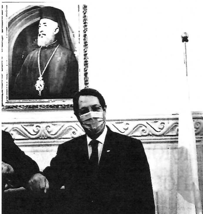
Κατά την αιφνιδιαστική επίσκεψή του στην Κύπρο ο αμερικανός ΥΠΕΞ τάχθηκε υπέρ του δικαιώματός της να εκμεταλλεύεται τους φυσικούς της πόρους