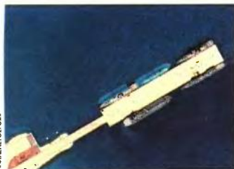
Η δορυφορική φωτογραφία ελήφθη στις 18 Αυγούστου και φαίνεται η μετακίνηση των πλοίων υποστήριξης, ώστε να μπορέσει να προσδέσει και το τρίτο πλοίο που φτάνει εντός 24ώρων εκεί