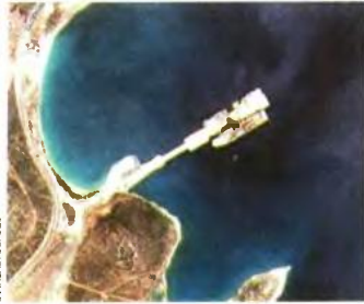
Το «Κανουνί» στη νότια πλευρά της στρατιωτικής προβλήτας στη Σελεύκεια και τα πλοία υποστήριξης «Levoli Ivory» και «Olympic Challenger» στη βόρεια πλευρά, από δορυφορική φωτογραφία που ελήφθη στις 16 Αυγούστου