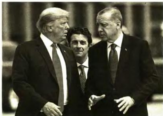
Η στενή σχέση Τραμπ - Ερντογάν έχει προσφέρει το προνόμιο στον τούρκο πρόεδρο να τηλεφωνεί στο Οβάλ Γραφείο όποτε αυτός το επιθυμεί

Η ΣΥΜΠΑΘΕΙΑ ΣΤΟΥΣ ΚΟΥΡΔΟΥΣ. Υπάρχει, βέβαια, και μια πιο ρεαλιστική προσέγγιση που βλέπει στον υποψήφιο των Δημοκρατικών έναν δυναμικό υποστηρικτή των ελλη-