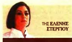
ΤΗΣ ΕΛΕΝΗΣ ΣΤΕΡΠΙΟΥ

Σαν να μπήκε σε χρονοκάψουλα η ελληνική οικονομία, διακτινίζεται πάλι σε αρνητικά εδάφη, με τις προβλέψεις των αναλυτών να δείχνουν ποσοστά που θυμίζουν την ύφεση του 2010 ή του 2011, με συρρίκνωση έως 8%. Ομολογουμένως, οι αριθμοί, σε συνδυασμό με τις ευρωπαϊκές αποφάσεις περί «πιστοληπτικών γραμμών» από τον Ευρωπαϊκό Μηχανισμό Σταθερότητας, Ξυπνού μνήμες μνημονιακών εποχών, όταν η χώρα βυθίστηκε στη δίνη της δημοσιονομικής κρίσης. Αδιαμφισβήτητα, η ελληνική οικονομία μπαίνει σε ακαρτογράφητα νερά. Ούτε η Ευρώπη ούτε ο πλανήτης ολόκληρος θα είναι ίδια ύστερα από αυτή την «πολεμική» κρίση. Το 2020 είναι