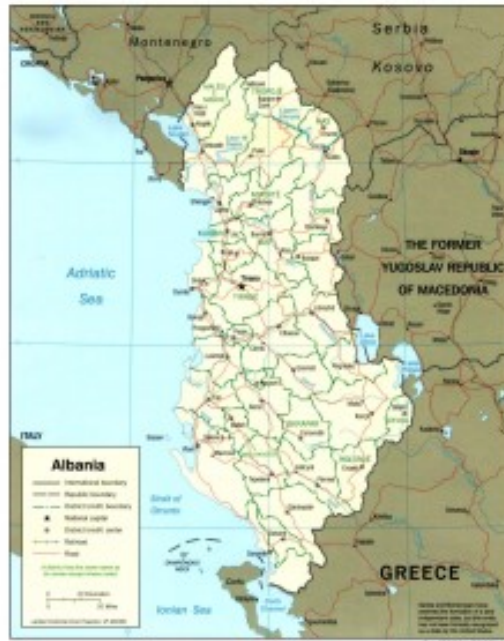
Εικόνα 1: Χάρτης της Αλβανίας