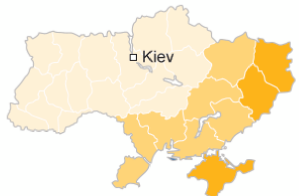
Russian as native language

Tymoshenko ■ 70%+ ■ 50-69% Yanukovich ■ 70%+ ■ 50-69%