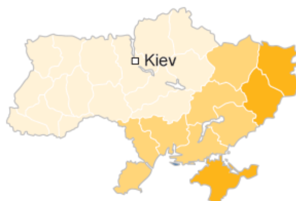
Russian as native language

Tymoshenko ■ 70%+ ■ 50-69% Yanukovich ■ 70%+ ■ 50-69%