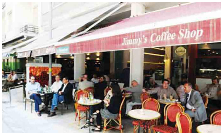
Η πεζοδρόμηση των οδών Βαλαωρίτου και Βουκουρεστίου, γύρω στο 1978, έφερε μια μεγάλη ανατροπή στα διπλωματικά μας ήθη και έθιμα, καθώς τα νέα «κέντρα λήψης αποφάσεων» φέρουν τώρα τα ονόματα «Τζίμυς», «Μπρασερί» και τα περίξ αυτών.

Υπάρχουν οι μόνιμοι και τακτικοί διπλωματικοί θαμώνες στους οποίους, προς αποφυγήν παρανοήσεων, περιλαμβάνω τους Ο.Ε.Υ. και τους εμπειρογνώμονες που συνδιαλέγονται μεταξύ καπουτσιόνο και εσπρέσο με τους -παρεπιδημούντες τη διπλωματική Ιερουσαλήμ- έγκυρους διπλωματικούς και παραπολιτικούς συντάκτες. Ορισμένοι εκ των οποίων έχουν, κατά κανόνα, εγκυρότερη εκ των έσω πληροφόρηση από την πλειοψηφία των διπλωματών! Φαινόμενο και αυτό της δικής μας εποχής. Μια πρακτική που έχει την ιστορική της αφετηρία το Νοέμβριο του 1984 με την διαρροή, προς συγκεκρι-