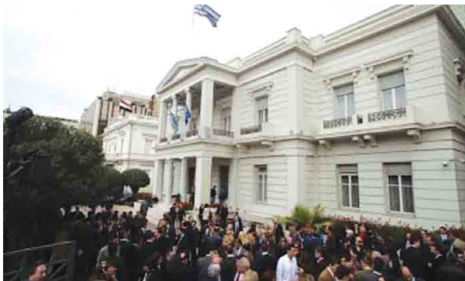
Το υπουργείο Εξωτερικών δεν αποτελεί πλέον μια καλή επαγγελματική επιλογή που προσφέρει ευπρεπείς συνθήκες διαβίωσης, καθώς η οικονομική ισοπέδωση όλων προς τα κάτω (στη φωτογραφία, στιγμιότυπο από την απεργία όλων των κλάδων το 2010) έχει κλονίσει τα θεμέλια της διπλωματικής υπηρεσίας.

προς τα κάτω έχει κλονίσει τα θεμέλια της διπλωματικής υπηρεσίας. Στην πραγματικότητα δεν υπάρχουν κίνητρα.