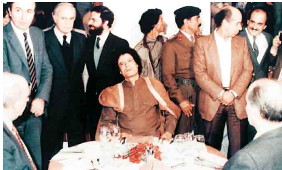
Ορισμένοι διπλωματικοί και παραπολιτικοί συντάκτες έχουν εγκυρότερη, εκ των έσω, πληροφόρηση από την πλειοψηφία των διπλωματών, καθώς συνεχίζεται η πρακτική των διαρροών που άρχισε, το Νοέμβριο του 1984, με τη σημαντική και αποκλειστική πληροφορία για τη συνάντηση της Ελούντας μεταξύ Αν. Παπανδρέου, Μ. Καντάφι, και Φρ. Μιτεράν.

κριμένη εφημερίδα, μιας σημαντικής και αποκλειστικής πληροφορίας (συνάντηση της Ελούντας μεταξύ Ανδρέα Παπανδρέου, Μουαμάρ Καντάφι, και Φρανσουά Μιτεράν).