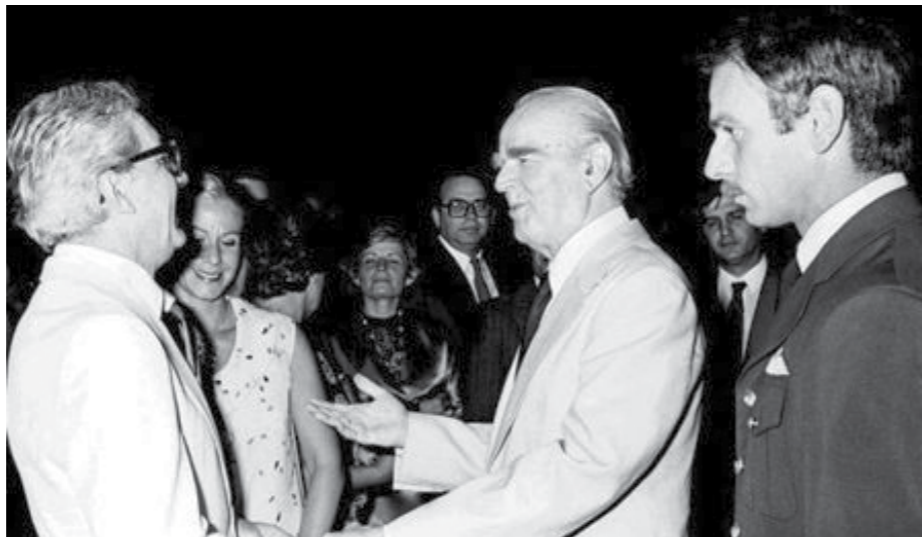
Αν και σε ορισμένες δεξιώσεις, όπως στη θερινή για την αποκατάσταση της Δημοκρατίας (στη φωτογραφία, ο Κων. Καραμανλής με τον Δημ. Χορν το 1981) επιτρέπονταν εξαιρέσεις, ο κανόνας απαιτεί μαύρα κουστούμια και λευκά πουκάμισα αντί των «μουσταρδι» αποχρώσεων του γράφοντος.

Η δική μας η δουλειά, όσο περνούν τα χρόνια, γίνεται δυσκολότερη, πιο απαιτητική και ζητά θυσιές και αυταπάρνηση. Το υπουργείο Εξωτερικών δεν αποτελεί πλέον ούτε αυτό, που θα λέγαμε κάποτε, μια καλή επαγγελματική επιλογή που σου προσφέρει, ιδίως όταν υπηρετείς εκτός Ελλάδος, ευπρεπείς συνθήκες διαβίωσης. Η οικονομική ισοπέδωση όλων