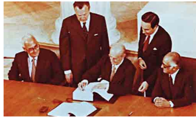
Μια Ελλάδα που έγινε, το 1981, μέλος της ΕΟΚ και φάνηκε να είναι, για δεκαπέντε περίπου χρόνια, η «πετυχημένη ιστορία» της Ευρωπαϊκής Ένωσης στην Νοτιοανατολική Ευρώπη κατάντησε σε μια Ελλάδα με περιορισμένη εθνική κυριαρχία και σύστημα πολιτικών συσχετισμών που απομακρύνεται από τις αγωνίες των πολιτών.

Δεν ξέρω για ποιόν λόγο, γιατί ένα από τα πρώτα πράγματα που σου λένε είναι το (αποδιδόμενο εις τον καλό μας συνάδελφο Ταλεϋράνδο) «και πάνω από όλα