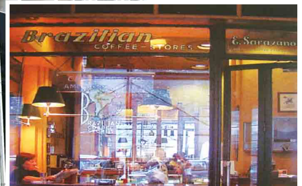
Στα δικά μας τα χρόνια, πέραν των διαδρόμων, σημαντικό εξωκτιριακό κέντρο ζύμωσης ήταν το περίφημο «Μπραζιλιαν».

Στα 35 χρόνια που υπηρέτησα στο Υπουργείο, προσπαθούσα πάντοτε να παρακολουθήσω τις προφορικές εξετάσεις που γίνονται δημόσια. Συνεπώς, χωρίς να είναι τέλειες, έχουν πάντως αυξημένο το τεκμήριο της εγκυρότητας. Κάθε φορά που έχουμε εξετάσεις, ο διάδρομος ή -καλύτερα- οι διάδρομοι των κτιρίων του Υπουργείου αποτελούν, όπως άλλωστε συνηθίζεται, την πηγή «εγκύρων» πληροφοριών που σπάνια επιβεβαιώνονται. Ποιος έχει δόντι, ποιος στηρίζεται από το σύστημα και τα λοιπά!