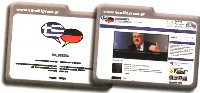
Η πρώτη εικόνα που σε καλωσορίζει στο site. Τίτλος: "Φιλία στην εποχή της κρίσης".