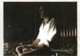
«Ζούσαν σ' ένα όμορφο διαμέρισμα»

«Υπήρξαν και καλύτερες εποχές για τις ελληνογερμανικές σχέσεις. Μαζί με την κρίση, τα ΜΜΕ ξεκίνησαν να τροφοδοτούν την κοινή γνώμη με στερεότυπα και κλισέ. Αυτού του είδους τα στερεότυπα φιλοδοξεί να καταρρίψει το Ίδρυμα Konrad Adenauer ως φορέας που προωθεί την κατανόηση μεταξύ των λαών.»