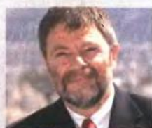
Ο Γερμανός πρόεδρος Wolfgang Dold.