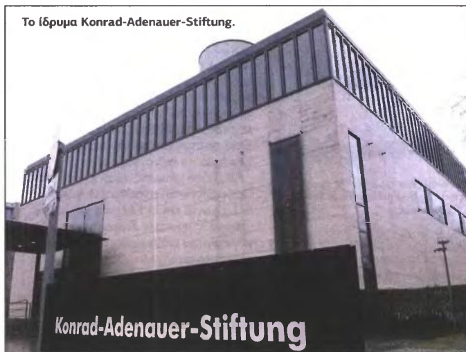
Το ίδρυμα Konrad-Adenauer-Stiftung.

Παρά το γεγονός ότι μαζί με τα άλλα γερμανικά ιδρύματα το KAS προωθεί έννοιες όπως η δημοκρατία, η ελευθερία, η δικαιοσύνη κ.ά., αναπαράγει επίσης απόψεις που συνάδουν με την ιδεολογία και την εκάστοτε στρατηγική