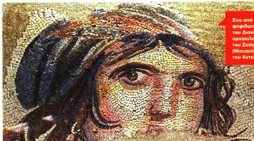
Ενα από τα ψηφιδωτά (πιθανόν του Διονύσου) στον αρχαιολογικό χώρο του Ζεύγματος (Μουσείο Ψηφιδωτών του Αντη)

Το ελληνικό κοινό αποδέχεται κυρίως ότι η Τουρκία είναι μια εχθρική χώρα (στιδήποτε κάνει είναι προκλητικό), καθώς επίσης ότι η μοναδική έγνοια της πολιτικής τάξης είναι να ασχολείται με την Ελλάδα. Ακόμα και για την επένδυση των Μαρίνα του Φλοίοβου αρκετά ΜΜΕ στην Ελλάδα έκαναν λόγο για «απόβραση των Τούρκων» στο Φάληρο. Άλλο παράδειγμα ήταν η συζήτηση για το ενδεχόμενο επικαιροποίησης της Συνθήκης της Λωζάνης, που χάθηκε στον ορυμαγδό των αντιδράσεων των ελληνικών ΜΜΕ, ενώ πούθενά δεν προέκυπτε ότι η αμφισβίτηση της Συνθήκης ανέκλυμε με σκοπό τη διεκδίκηση ελληνικών εδαφών. Οι απόψεις του Ερντογάν στο εν λόγω ζήτημα έχουν διατυπωθεί και στο παρελθόν. Οι σκοποί του είναι αφενός η ιδεολογική αντιπαράθεση με τους κεμαλιστές και αφετέρου οι τουρκικές αξιώσεις στα εδάφη της βόρειας Συρίας και του βόρειου Ιράκ, λόγω της ανάδυσης εκεί κοινωδικών πολιτικών οντοτήτων που διεκδικούν αυτονομία ή ανεξαρτησία. Πέρα από την ανάλυση, ο Γρηγοριάδης προχωρά σε συγκρίσεις με την Ελλάδα και προτείνει πολιτικές: για την ανώτατη παιδεία, το μεριστικό, την κατασκευή του τεμένους στον Βοτανικό, τις οικονομικές σχέσεις, το Κυπριακό κ.ά.