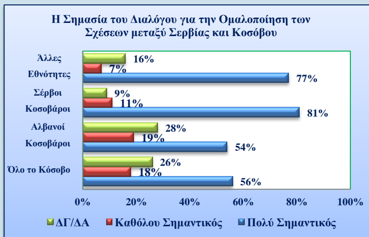
Post – Election Public Opinion Poll in Kosovo, USAID, 2011

Αλλά και για την Πρίστινα τα πράγματα δεν είναι ρόδινα. Η κοσοβαρική πλευρά θα μπει στο νέο γύρο των διαπραγματεύσεων με στόχο να αποδυναμώσει ή να τερματίσει την παρουσία του σερβικού κράτους στο βορρά. Η Πρίστινα θα προτιμούσε να μην συζητηθεί στο νέο γύρο των διαπραγματεύσεων το θέμα του καθεστώτος του βορρά, φοβούμενη πιθανές υποχωρήσεις υπό την πίεση της διεθνούς κοινότητας. Σε περίπτωση που ο διάλογος